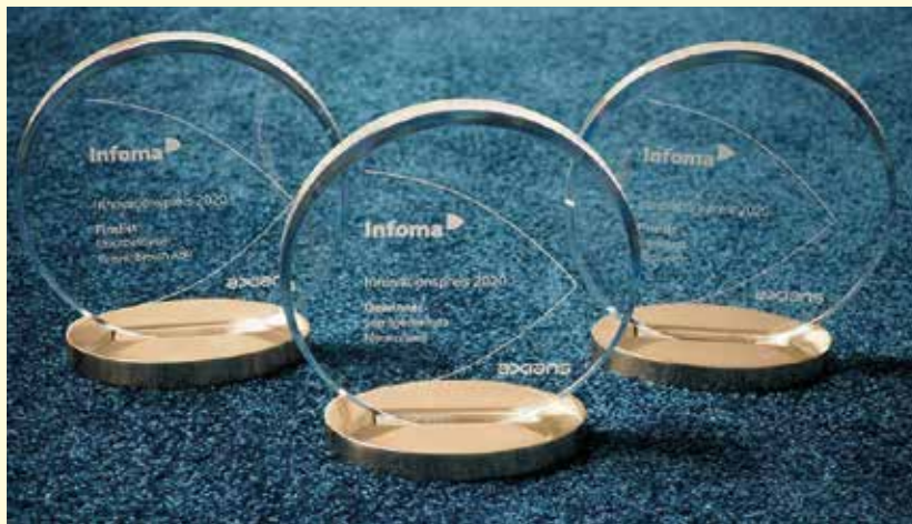
Der Innovationspreis würdigt außerordentliche Digitalisierungsprojekte.

Weiß (Hochschule Harz): Ich würde gerne noch auf einen anderen