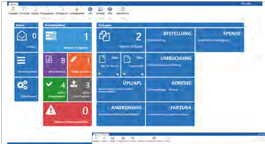
Startseite im Infoma ePortal